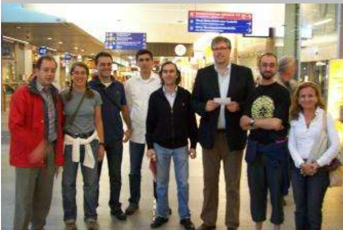
La foto fue tomada en la estación intermodal de Kamppi en Helsinki

Confiamos en que esta magnífica colaboración continúe en el futuro.