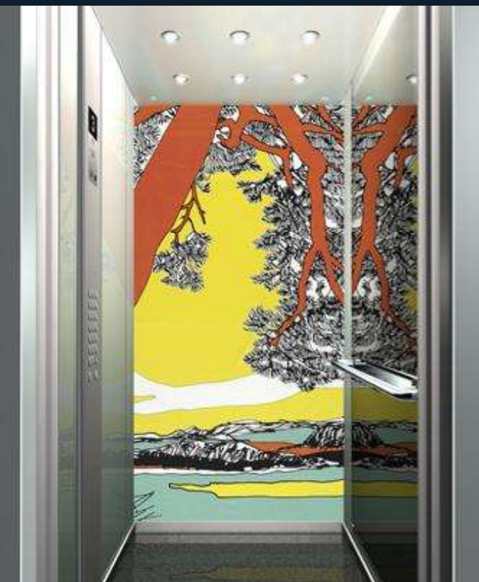
Diseños gráficos que transforman el ánimo. Tapiz de Maija Louekari en un ascensor de Kone

También Kone ha revestido con los estampados de Marimekko el interior de sus ascensores.