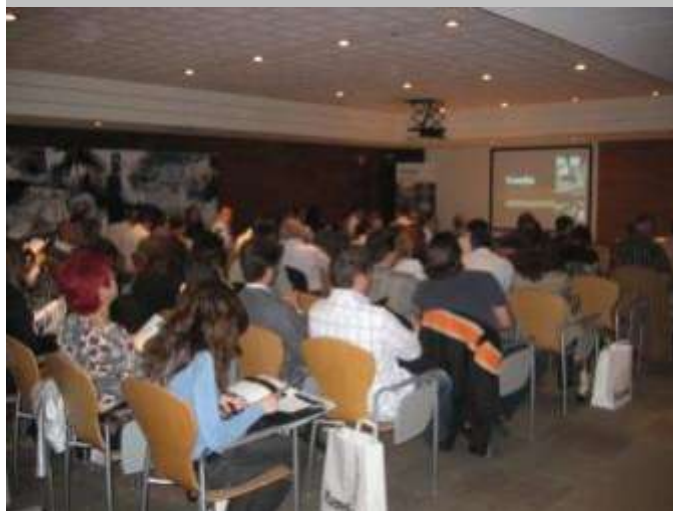
Imagen del acto de presentación de la nueva gama de productos de Karelia en el Hotel Miramar de Barcelona

Karelia es representada en España por Gabarró (Atención al cliente 93 748 48 38 – 902 266 660, Madrid)