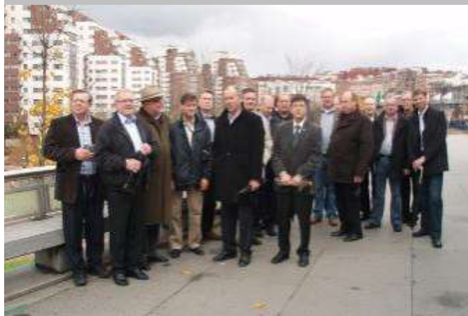
La foto fue tomada en el nuevo área de Ametzola en Bilbao.