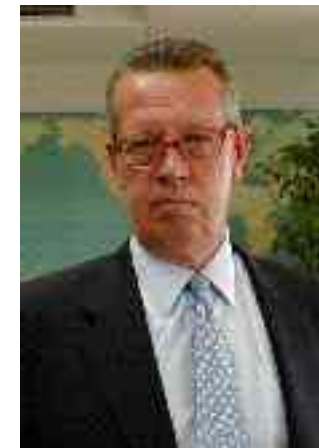
Pekka Korhonen Presidente de la Cámara

Desde nuestra Cámara queremos impulsar la comunicación entre empresas de ambos países para la búsqueda de proyectos conjuntos. Todas las sugerencias en este sentido serán bienvenidas.