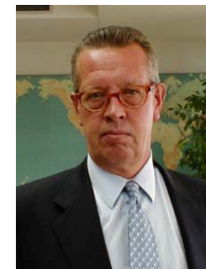
Pekka Korhonen Presidente de la Cámara

Estamos abiertos a la participación de patrocinadores cuya marca o logotipo aparezca en la página y contenga un enlace a su propia dirección. También pretendemos que participéis activamente informando vía email de acontecimientos en las relaciones entre Finlandia y España.